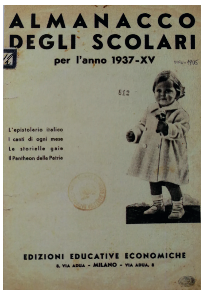
Almanacco degli scolari per l'anno 1937-XV, Milano, Edizioni educative economiche [1937]. Supplemento a La piccola italiana, n. 13 (gen. 1937)

Novecento, vedono l'affermazione della fotoincisione. Grazie all'evoluzione tecnologica è dunque innescata (ed economicamente sostenibile) l'esplosione del colore anche nei periodici che, a cominciare dai due grandi "rivali" – "Il Giornalino della Domenica" e il "Corriere dei Piccoli" – sono stati a lungo il medium privilegiato per veicolare le letture dei bambini.