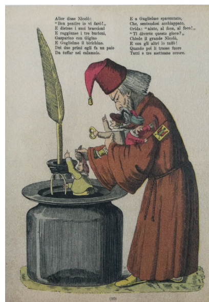
Heinrich Hoffman Donner, Pierino Porcospino , 7. ed. italiana, Milano, Hoepli [1935?]