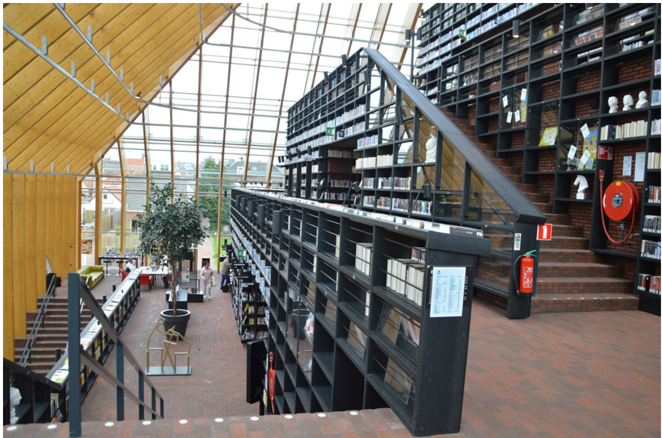
De Boekenberg. La strada interna si arrampica sui lati della piramide (in realtà una ziqqurat) con ampie scalinate