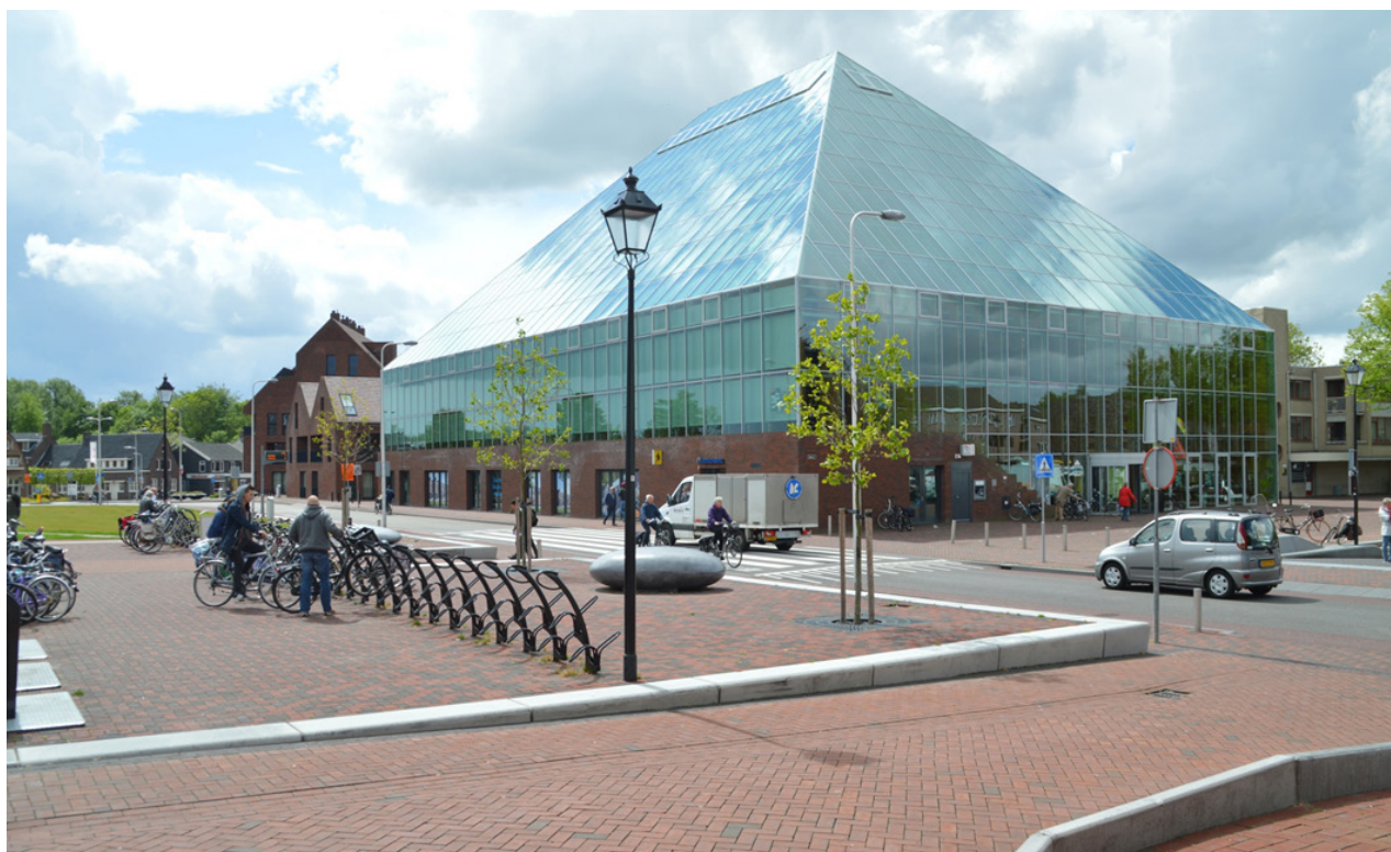
De Boekenberg a Spijkenisse è una piramide trasparente che rende visibili i libri anche dall'esterno

dell'imprenditoria (in preparazione una parte dedicata al fare impresa) e civile (ospita il locale circolo degli scacchi e l'associazione Spijkenisse Antica). Le sale interne (auditorium e altri spazi per riunioni) possono essere prese in affitto, così come la