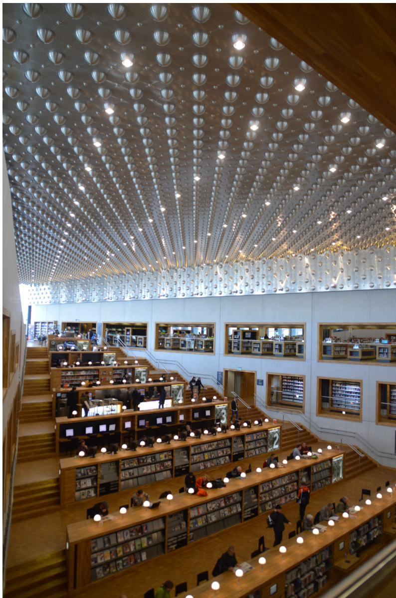
Eemhuis. La copertura metallica è ricoperta da mezze sfere che contengono l'illuminazione

vere questi edifici è quella di spazio urbano pubblico, di piazze del sapere 24 (ed oggi anche del fare) che rappresentano forse l'ultimo luogo veramente democratico ed attivamente socializzante che ci è rimasto. De Boekenberg a Spijkenisse è volutamente progettato come una strada che si arrampica a spirale lungo un corpo centrale ricoperto di libri, al punto tale che la classificazione dei libri si riferisce alla loro posizione lungo la strada, al loro indirizzo. La strada forma terrazzamenti e spazi di incontro pubblico dove avvengono tutte le attività. A volte essa penetra verso l'interno originando spazi più riservati e nicchie per lavorare concentra-