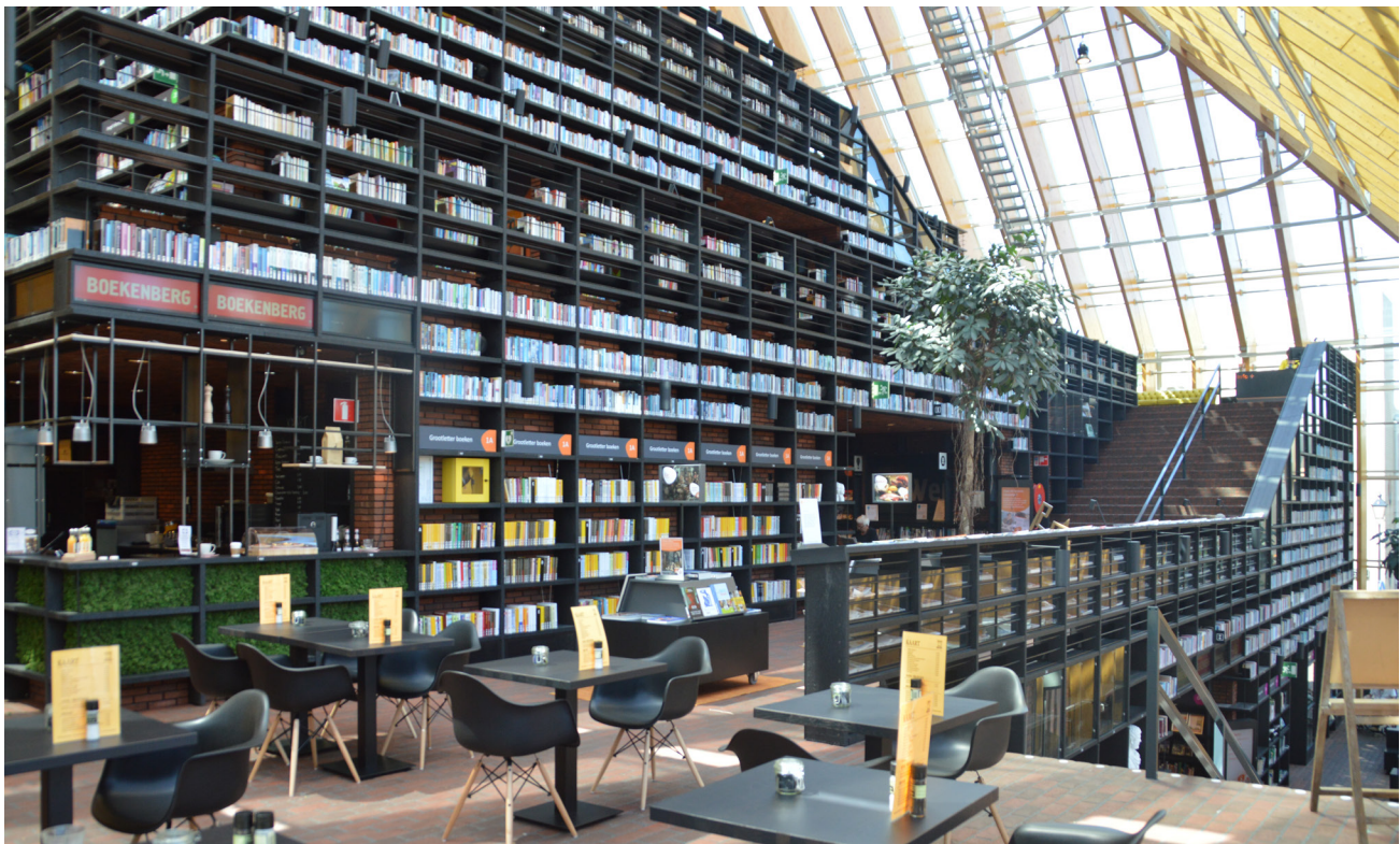
De Boekenberg. Interno. Le scaffalature rivestono tutte le pareti, compresi corrimani e balaustre. I libri sono usati come elemento decorativo ed identificativo della biblioteca