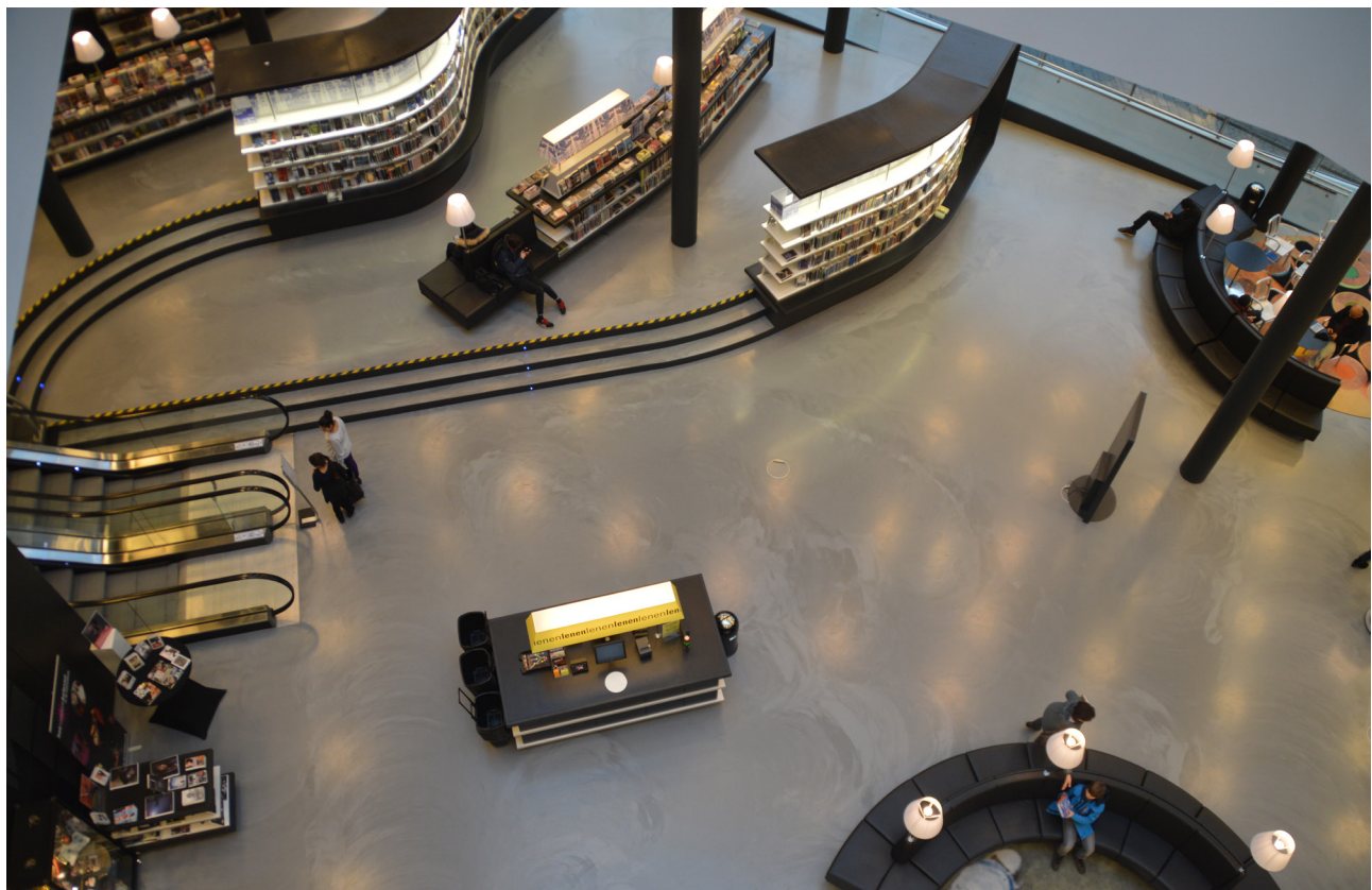
De Nieuwe Bibliotheek. Il landscape interno della biblioteca: scaffali per libri e molto spazio per sedersi e lavorare