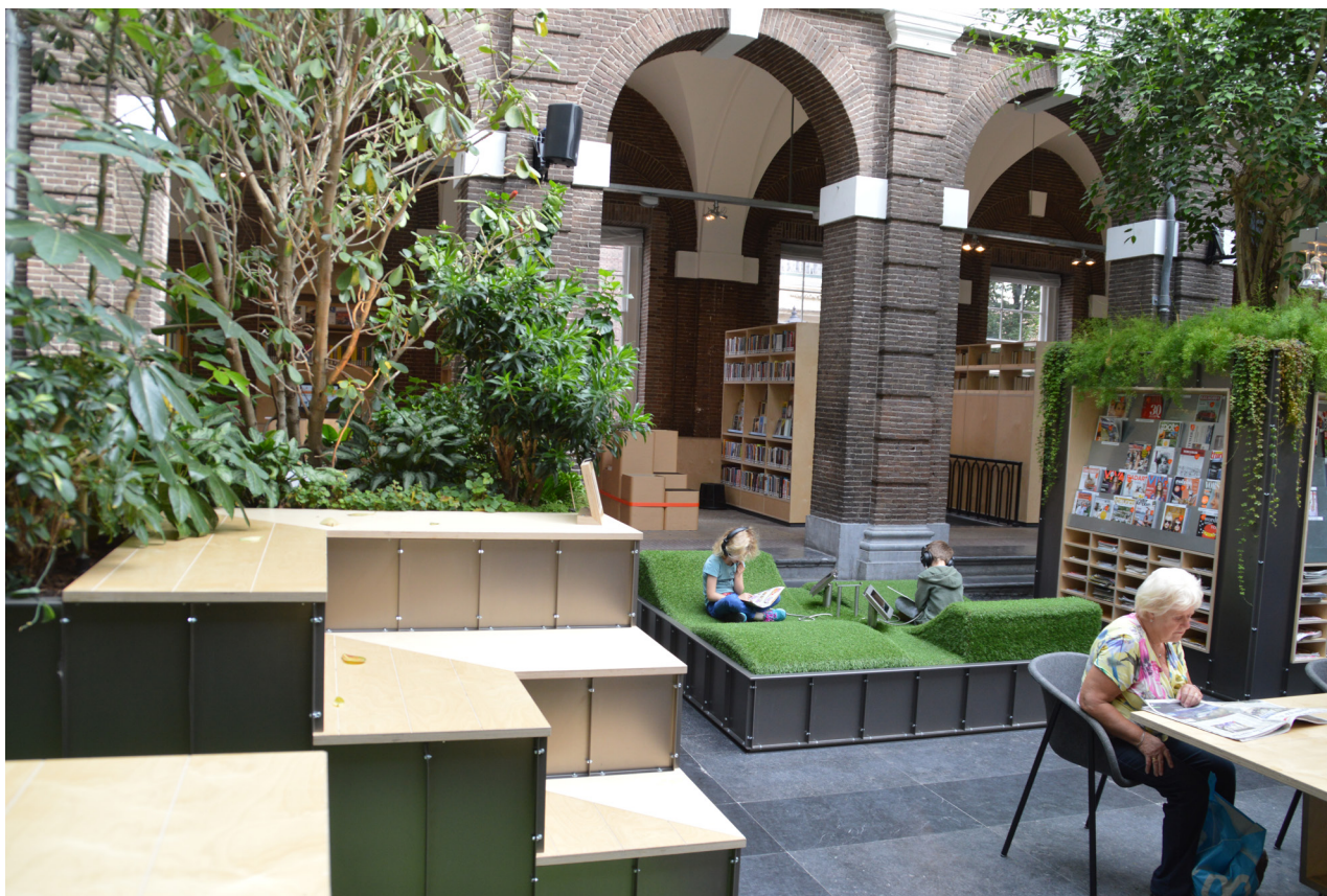
De Korenbeurs. Le biblioteche olandesi hanno in genere un'attenzione particolare per i bambini

popolato da mezze sfere che si illuminano a formare un cielo stellato. Infine De Korenbeurs, la nuova biblioteca di Schiedam, 25 è il recupero di un edificio del 1792 con una grande corte centrale che l'architetto ha trasformato in un giardino interno, una piccola oasi dove i visitatori possono passare del tempo sdraiati su panche verdi o leggendo sotto un albero. Anche questo è uno spazio urbano di valenza sociale, come tutte le biblioteche dovrebbero in primo luogo essere. People first.