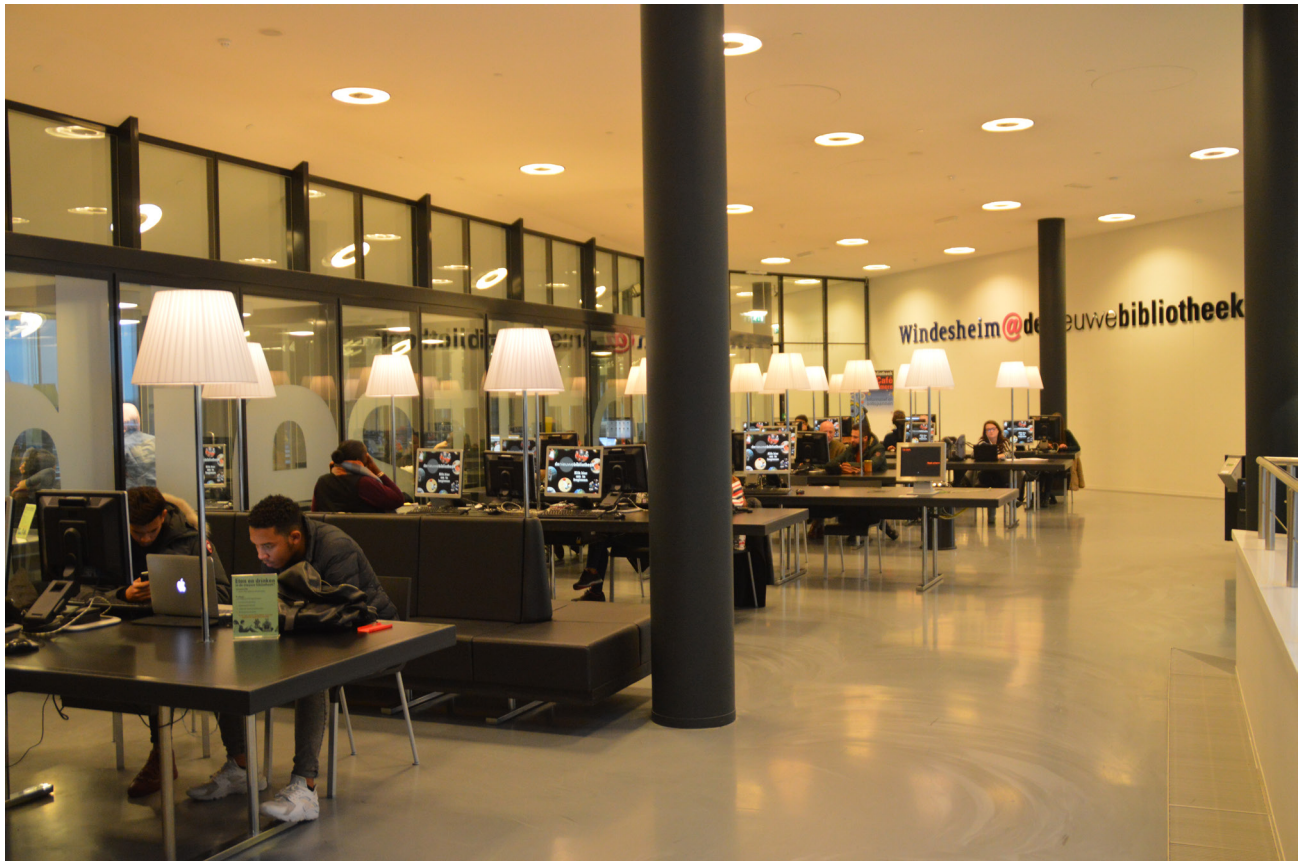
De Nieuwe Bibliotheek. La scuola superiore Windesheim ha una propria presenza nella biblioteca