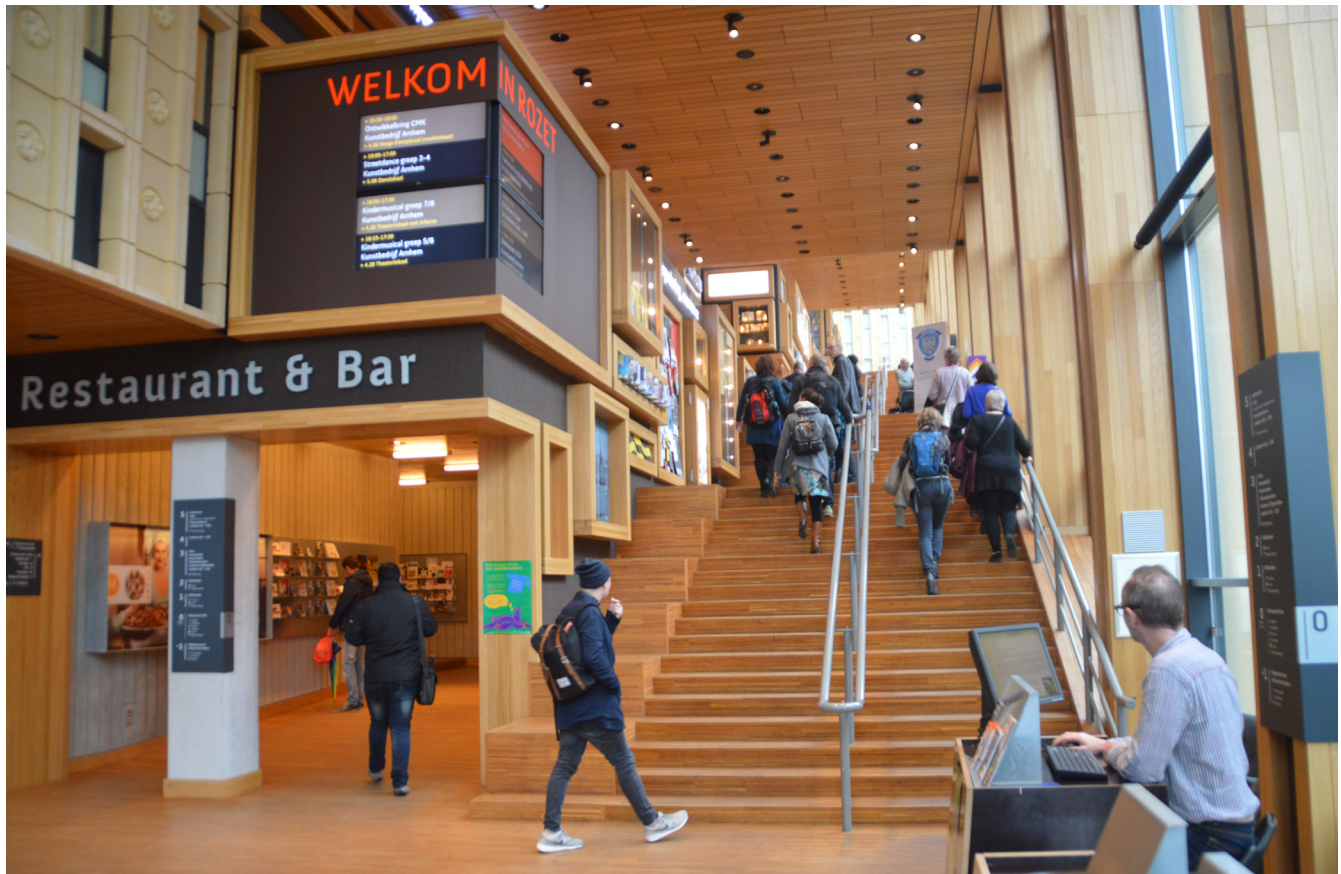
Rozet. La strada interna è una grande gradinata che avvolge il programma