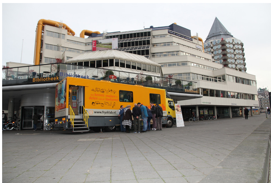
Il Frysklab davanti alla biblioteca centrale di Rotterdam

Il makerspace sta diventando una offerta sempre più familiare nelle biblioteche olandesi, ma non è l'unico modo in cui la biblioteca dà forma alla sua nuova vocazione sociale. Quasi tutte le biblioteche in Olanda offrono oggi un denso programma di incontri, lezioni, esposizioni, rappresentazioni, workshops, percorsi di recupero ed integrazione -