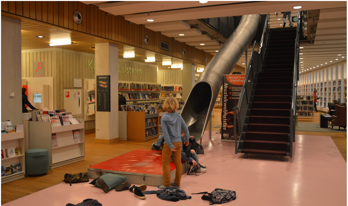
Rozet. Uno scivolo interno collega due piani della biblioteca. I bambini visitano la biblioteca molto volentieri