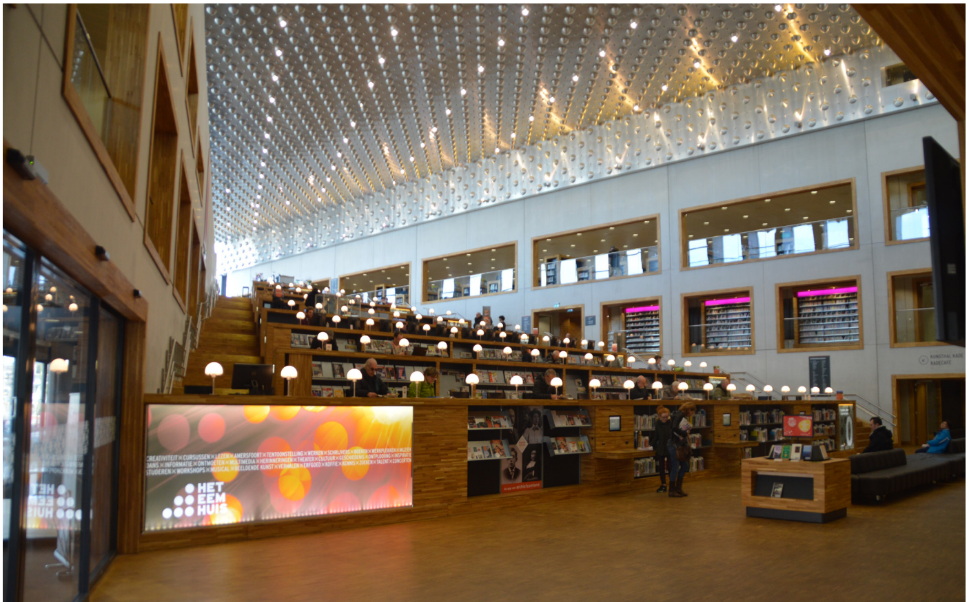
Eemhuis. Lo spazio centrale dell'edificio è una piazza gradonata dove è possibile consultare riviste e quotidiani, sedersi a lavorare o studiare, o passare del tempo