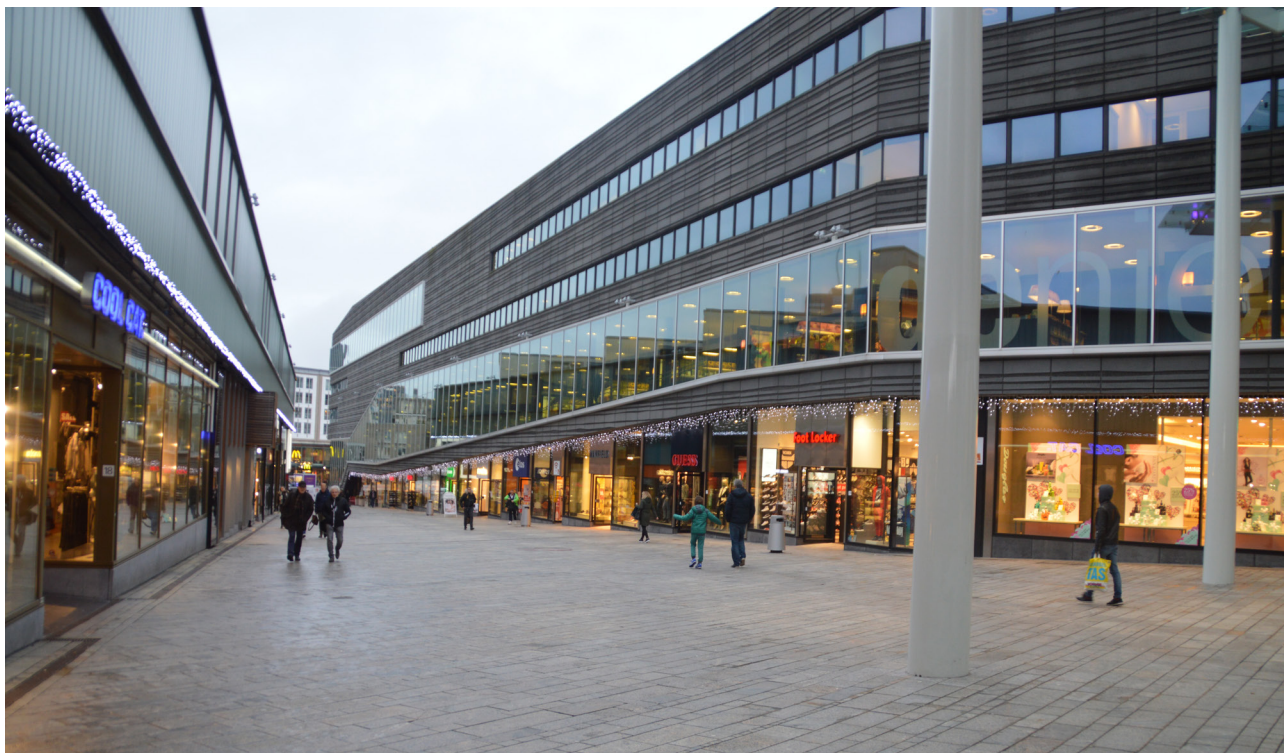
De Nieuwe Bibliotheek. La biblioteca è anche un'ancora per lo sviluppo urbano di questa zona centrale di Almere Stad, città nata circa 40 anni fa sulle terre conquistate al mare (polder di Fevoland). Il piano terra è stato volutamente lasciato libero per negozi ed altre attività urbane