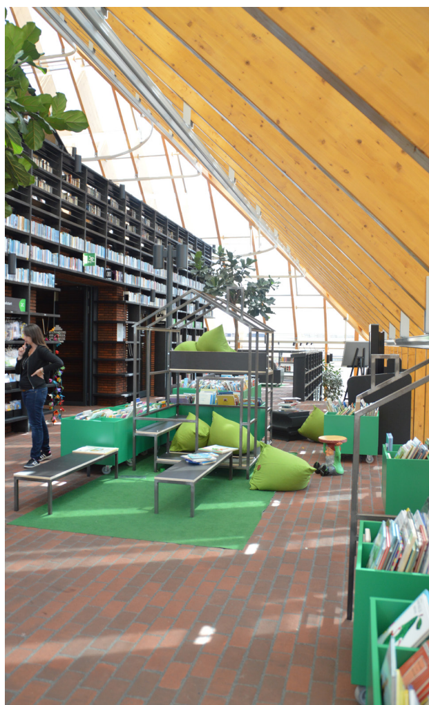
De Boekenberg. La strada forma terrazzamenti dove si tengono varie attività