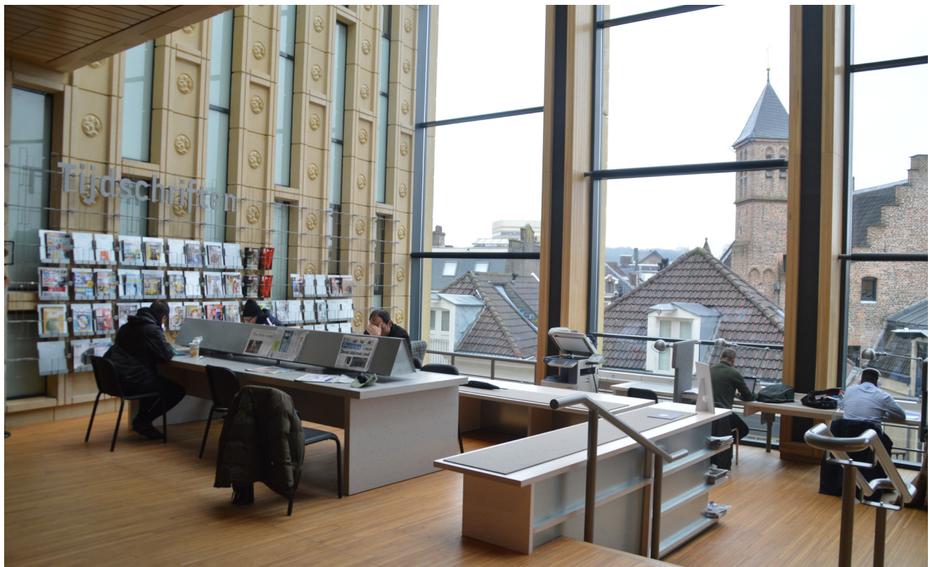
Rozet. Nei punti di svolta, la strada diventa una piazza che, in questo caso, fornisce una vista privilegiata su Arnhem storica. In quest'area si possono consultare riviste e quotidiani