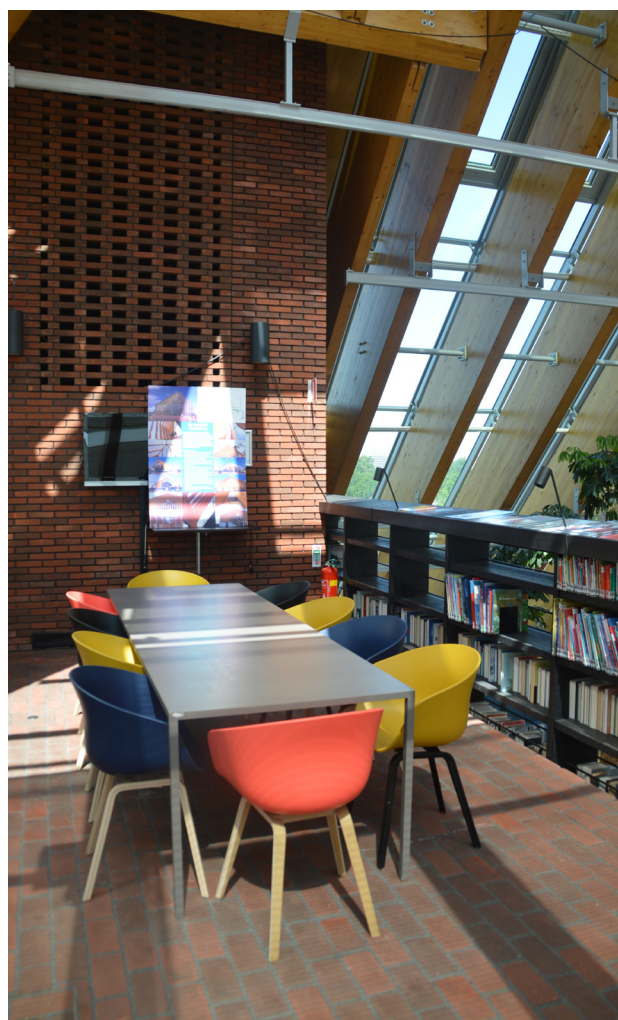
De Boekenberg. Postazione per lavoro di gruppo o workshop

terrazza-bar situata al punto più alto, al culmine della piramide. Un altro esempio di collaborazione in cui la biblioteca si allea con un altro attore locale si trova nella Nieuwe Bibliotheek 19 La nuova biblioteca di Almere Stad, inaugurata nel 2010, ospita anche locali e postazioni-studio della scuola superiore Windesheim, attiva nella regione, senza soluzione di continuità spaziale rispetto alle altre aree della biblioteca. I locali per le lezioni ospitano anche meeting, workshop ed altre attività; le postazioni-studio individuali o per piccoli gruppi consentono di studiare concentrati, ma possono essere utilizzate anche dagli altri utenti. De Nieuwe Bibliotheek contiene anche un auditorium. L'alleanza più stretta, e forse la più ovvia, è quella tra la biblioteca e l'amministrazione comunale. Infatti i comuni rimangono di gran lunga gli sponsor