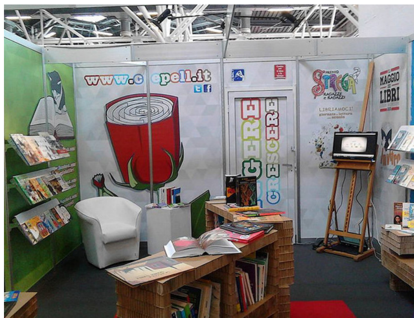
Stand Centro per il libro e la lettura - Bologna Children's Book Fair 2016

svolge l'iniziativa (dai tre giorni nella prima edizione si è passati a una settimana dal 2015), scrittori, attori, giornalisti, personaggi noti e lettori volontari diventano testimoni del piacere della lettura, coinvolgendo i ragazzi nell'ascolto e nella scoperta dei testi. La scelta di alleati più o meno famosi – dai ministri ai sindaci, dagli attori televisivi e teatrali agli scrittori, dagli scienziati agli sportivi, dai professionisti della lettura ai nonni di buona volontà – ha rappresentato una scelta strategica sia per comunicare la campagna sia per trasmettere energia, entusiasmo ed emozione attraverso il contatto umano, ma anche per far “sentire” ai giovani la rilevanza sociale di una pratica che rischia oggi di essere percepita come elitaria e solitaria. Con una settimana di lettura ad alta voce nelle scuole abbiamo soprattutto cercato di mostrare ai ragazzi che la lettura può essere innanzitutto un grande piacere.