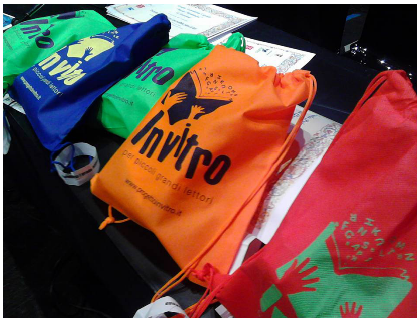
Kit In vitro

Non è stato trascurato il monitoraggio degli interventi realizzati: numerose famiglie sono state sottoposte a un sondaggio per individuare abitudini e comportamenti di lettura e per verificare l'efficacia degli interventi. Quello che il monitoraggio non ha potuto testimoniare è l'entusiasmo suscitato dal progetto nelle comunità, la partecipazione di tutti gli operatori, la commozione di insegnanti e bibliotecari di fronte alla pioggia di libri, tanti bei libri che hanno raggiunto scuole, biblioteche, famiglie. Ed è stato forse questo il principale valore aggiunto: senza abbondanza di libri di qualità non c'è iniziativa di promozione capace di accendere la scintilla che suscita la lettura, sono soprattutto i bei libri a stimolare la lettura e più libri circondano i ragazzi, più libri entrano nelle case e nelle scuole, maggiore sarà l'interesse nei confronti della lettura. Ovviamente, le criticità non sono mancate e hanno compromesso alcuni dei risultati previsti: la