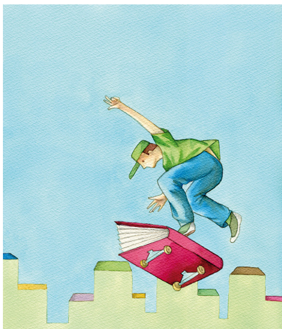
Illustrazione di Stefano Navarrini per In vitro

italiana all'estero (attraverso la partecipazione alle Fiere internazionali e il sostegno al portale www.booksinitaly.it ).