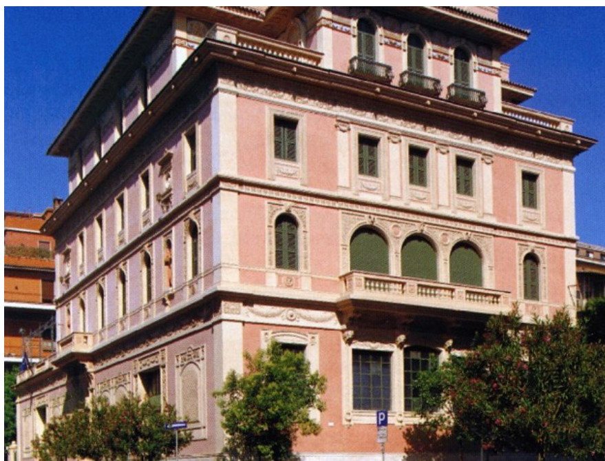
La sede del Centro per il libro

La quota di lettori in Italia è infatti tra le più basse del nostro continente: oltre la metà della popolazione non legge nemmeno un libro all'anno e le statistiche precisano che la maggior parte dei lettori sono lettori saltuari, mentre quelli forti, che leggono più di un libro al mese, rappresentano solo un'esigua percentuale del totale. Altri Paesi paragonabili al nostro fanno registrare percentuali di lettori ben più elevate (dati Eurobarometro): il 61% in Spagna, il 63% in Francia, il 73% in Austria, l'80%