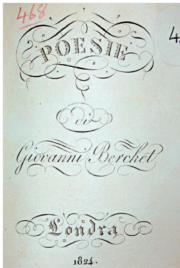
Frontespizio dell’edizione 1824 delle Poesie di Giovanni Berchet

L’edizione 1824 delle Poesie è una raccolta di poemetti lunghi che Giovanni Berchet “pubblicò da primo, sotto il titolo di romanze , messo alla moda appunto dal romanticismo”. 52 “Le Romanze , composte tra il 1822 e il 1828, furono le poesie del Berchet più largamente popolari, quelle che attuarono più compiutamente il programma della Lettera semiseria , il programma, cioè di una poesia indirizzata alla intelligenza del popolo, ispirata alle tradizioni volgari e al sentimento del presente, d’animo e d’intendimenti nazionali [...]. Il Berchet volle dare alle romanze , che egli tanto ammirava nella letteratura tedesca, inglese, francese, spagnola, un contenuto di realtà storica e politica”. 53