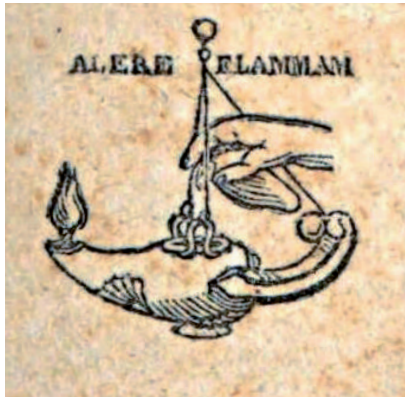
Marca tipografica apposta a diverse edizioni delle Poesie di Berchet

Il prossimo dettaglio bibliografico che il nostro "let-