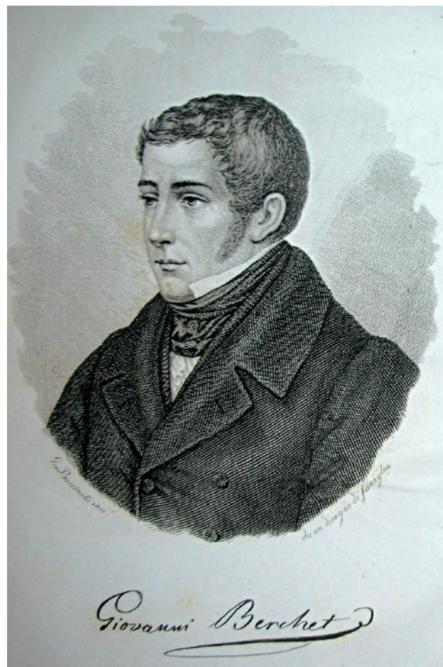
Giovanni Berchet in un'incisione di Giuseppe Buccinelli

Non sarà un'indagine critica sullo stile, sulla lingua o sulle fonti del Berchet, nonostante la bibliografia cor-