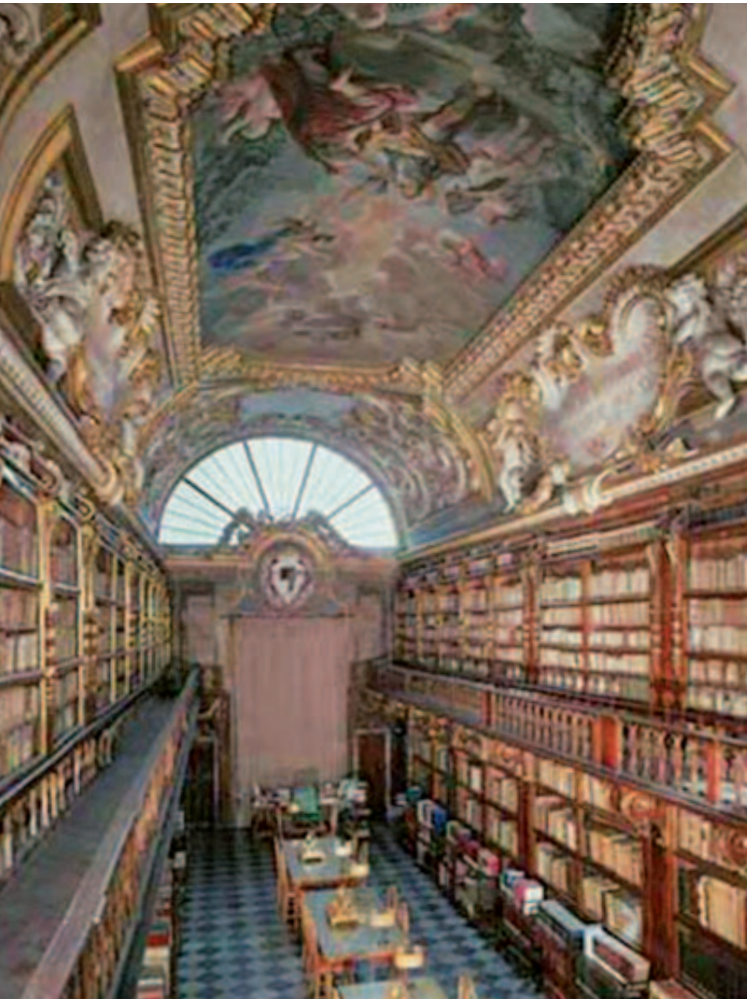
La Biblioteca Riccardiana di Firenze, di cui Morpurgo fu direttore dal 1888 al 1898

la direzione vacante), ma anche altre biblioteche. 16 Ma pochi mesi dopo, nell'autunno 1888, fu proprio Morpurgo che passò a dirigere a Firenze, la prestigiosa