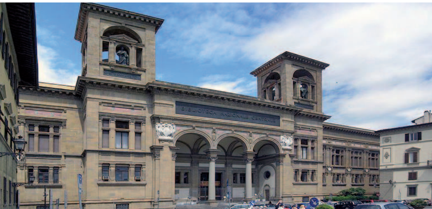
Salomone Morpurgo diresse la Biblioteca nazionale centrale di Firenze dal 1905 al 1923

dall'autografo conservato alla Nazionale. Così il triestino precisò ironicamente: