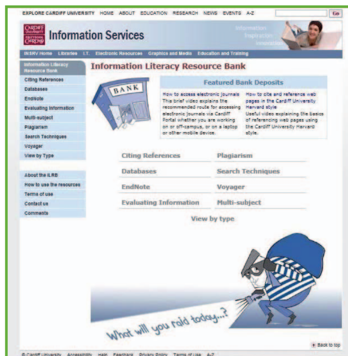
L'"Information Literacy Resource Bank" creato dall'Università di Cardiff

I subject librarians dedicano un'attenzione particolare alla competenza informativa anche attraverso la creazione di appositi materiali ospitati online sul sito web dell'università. L'Università di Cardiff ha creato un repository di learning objects , denominato "Information Literacy Resource Bank", che copre tutti i contenuti dell'alfabetizzazione informativa, dalla pianificazione della ricerca all'utilizzo del catalogo d'ateneo, alle banche dati, alle tecniche di ricerca. 22 Altri materiali riguardano la costruzione di bibliografie e gli stili di citazione, il plagio e la valutazione delle informazioni reperite. Si tratta di guide, tutorial, screencast, podcast, video, diagrammi, immagini e quiz; si è cercato di creare materiali per lo più interattivi che possano suscitare l'interesse degli studenti e che favoriscano un apprendimento learning-by-doing . Per la creazione dei prodotti di complessa realizzazione, come i video, le biblioteche si rivolgono ai servizi informatici di ateneo, mentre altri strumenti sono creati direttamente dagli stessi bibliotecari. I materiali sono prodotti anche grazie al fondo stanziato dall'università per il progetto di "Innovative Teaching and Learning" e sono protetti dalle licenze Creative Commons. Alcuni learning objects sono ospitati anche sulla piattaforma blackboard di ateneo denominata "Learning Central".