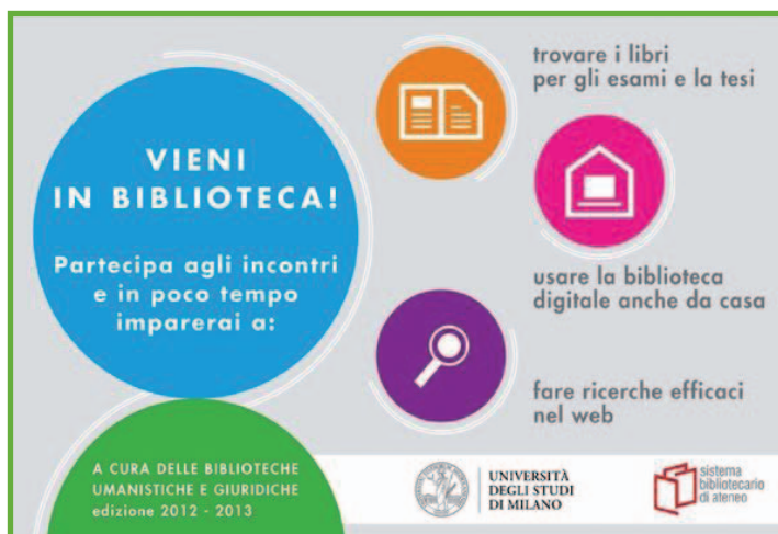
Cartolina dell'ultima edizione di "Vieni in biblioteca!"

Il lavoro del gruppo ha portato all'organizzazione di un calendario di incontri, alla creazione di cartoline promozionali (come quella che si può vedere in questa pagina) e alla realizzazione di materiali didattici. Gli incontri sono stati divisi secondo il calendario accademico in primo e secondo semestre e sono stati realizzati sia nella sede centrale che in quelle più decentrate. In ogni incontro sono stati distribuiti questionari di valutazione.