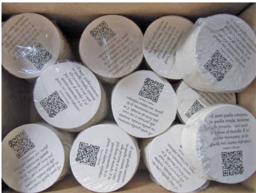
I sottobicchieri con QRcode ideati dalla Rete bibliotecaria cremonese per diffondere la conoscenza dei servizi bibliotecari in modo inconsueto

Per farla semplice, la domanda di fondo su cui si accettavano e si accettano riflessioni, proposte e magari anche scommesse era: dove andranno i bibliotecari? Si disperderanno nell'ambiente, ma riciclandosi, come suggerisce Galluzzi, magari proprio partendo dai sottobicchieri letterari del tutto anonimi (finché, incuriositi, non se ne fotografa il QR code...) che il progetto "Extratime" si propone di distribuire nei locali della zona? (Che poi è una versione rinnovata dell'andare "fuori di sé", cappello che raccolse tante delle iniziative extra muros delle biblioteche a partire dagli anni Novanta). In questo caso, tenendo come punto focale l'analisi del convegno, si dovrebbe parlare allora di "bibliotecario fuori di sé"