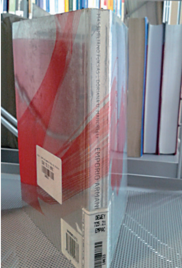
Figura 1 – Copertina di: Massimiliano Fuksas e Doriana O. Mandrelli, Emporio Armani Chater House , Hong Kong, Barcellona, ACTAR [2003]

una molteplicità quasi borghese di biblioteche, che di moda trattano, occorrerà dunque – e di questa istanza si occupa la seconda parte dell’articolo – ipotizzare le prospettive e, possibilmente, le soluzioni che riconducano a unitarietà tale panorama diffuso.