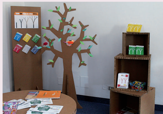
Un angolo della sala Toscanini che per due giorni è stata animata dalle biblioteche del Sistema urbano di Milano. Nell’immagine, un particolare degli arredi e della documentazione dell’iniziativa “SBM for Expo in città e la cucina delle storie”