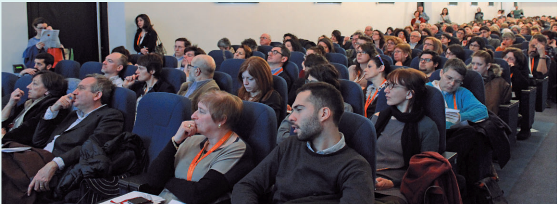
Sala Volta: pubblico numeroso durante la sessione "Un libro è un libro..." di venerdì 13 mattina