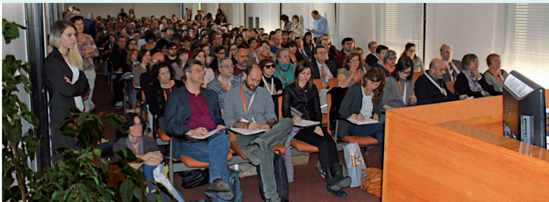
L'affollata sessione che si è svolta nel pomeriggio di venerdì 13 marzo in Sala Manzoni