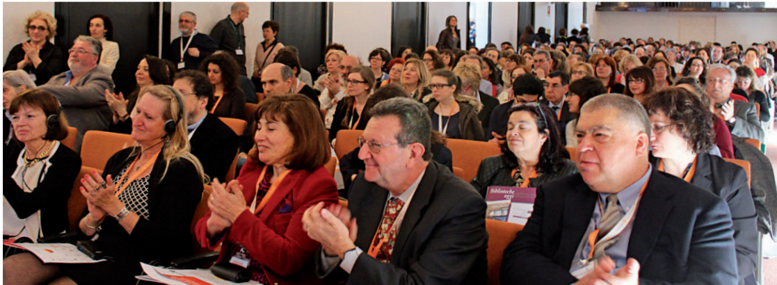
Sala Manzoni: folto pubblico in apertura dei lavori giovedì 12 marzo