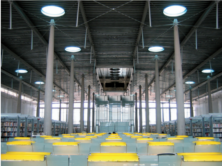
Phoenix Public Library, Arizona