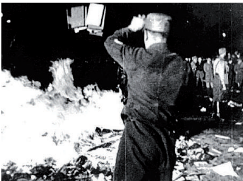
Nelle immagini sono visibili due Bücherverbrennungen avvenuti nel 1933 a Berlino

to a guerra ultimata, quasi “una seconda Controriforma”. Scarso, comunque, durante la guerra, il coordinamento tra le biblioteche, senza regole comuni né garanzie professionali, con eccezione per la biblioteca universitaria di Vienna. Il che non esclude per i bibliotecari, in Austria come in Germania, il livello elevato della preparazione professionale con paleografia, storia del libro, bibliografia, latino, greco