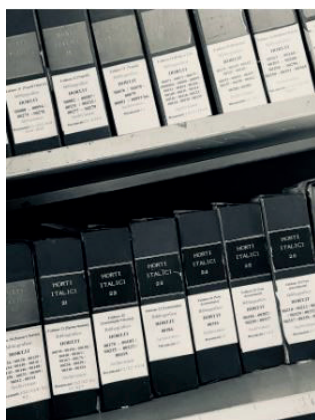
Figura 2 - I faldoni della collezione dopo l'etichettatura

Per quanto riguarda il report le prime colonne descrivono, da sinistra verso destra, prima il faldone, con