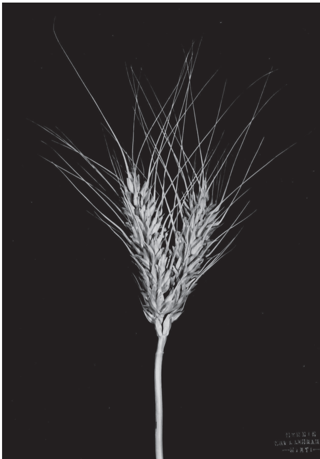
Figura 4 - La fotografia della fase di germinazione di una spiga

indicazione, di luogo, può venire dalla collocazione della fotografia in uno specifico faldone.