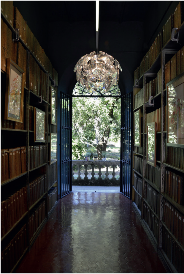
Figura 1 - Veduta dell'Orto botanico dal corridoio dove sono situate le collezioni miscellanee

raccolte miscellanee, il primo obiettivo, di carattere generale, è stato quello di ricercare un metodo valido per trattare questo tipo di collezione: si è voluta individuare una modalità strutturata di esame, trattamento e comunicazione al pubblico, iniziando dalla raccolta numericamente più ridotta. Il metodo potrà poi essere utilizzato per esaminare e trattare altre collezioni più importanti dal punto di vista del numero di documenti.