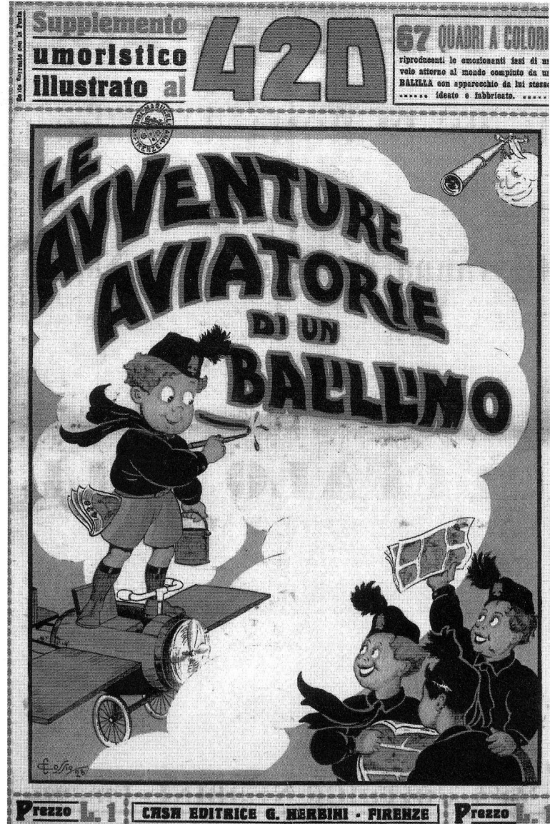
Il primo albo a fumetti della casa editrice Nerbini, edito nel 1928 come supplemento al settimanale satirico "420"

rio, con rapporti assai disuguali con gli autori e con gli editori. Un numero limitato di editori ebbe la maggior parte delle commesse; tra i favoriti Sansoni, legato a Giovanni Gentile, e Mondadori, al quale giovò l'adozione del testo unico per le scuole elementari, mentre ne fu danneggiato Bemporad, particolarmente forte nell'editoria scolastica. A questa circolazione pilotata partecipò attivamente l'Ente nazionale per le biblioteche popolari e scolastiche, nato nel 1932, la cui politica degli sconti in esclusiva suscitò proteste da parte dei librai. La sua attività è indicativa del passaggio al potere politico di funzioni sociali