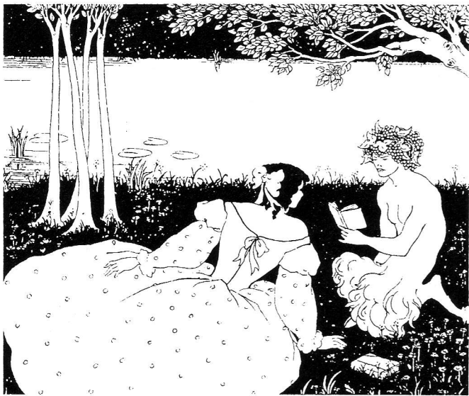
Illustrazioni di Aubrey Beardsley