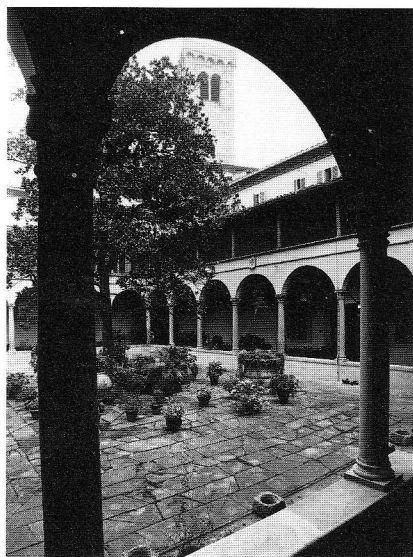
La sede dell'Istituto universitario europeo a San Domenico di Fiesole

Occasione unica e ghiotta di confronto di tecnici con un tecnico assunto ad un ruolo politico. Si percepiva nella sala l'orgoglio dei bibliotecari di aver espres-