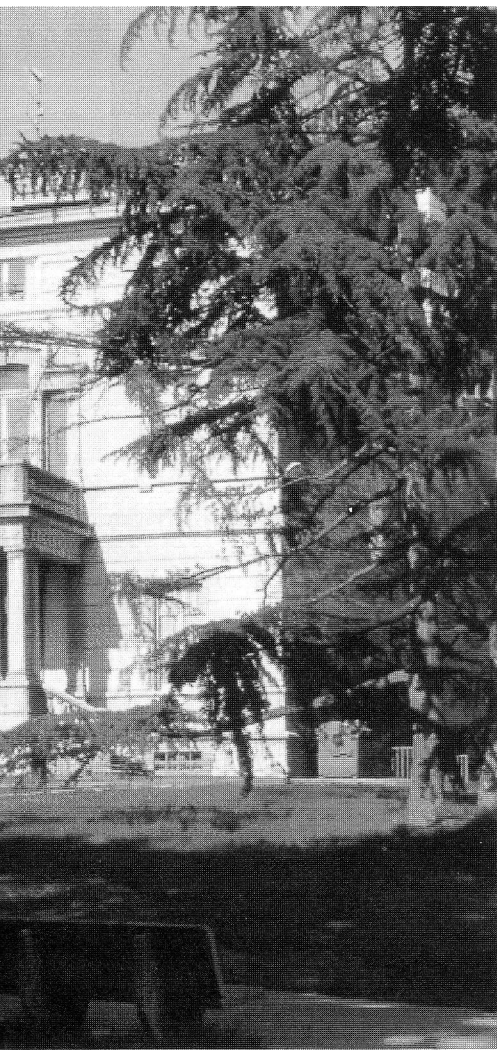
◀ Nelle foto che corredano l'articolo immagini della Biblioteca comunale di Alzano Lombardo.

comunque si voglia) che meglio risponde alle caratteristiche di ciascun servizio.