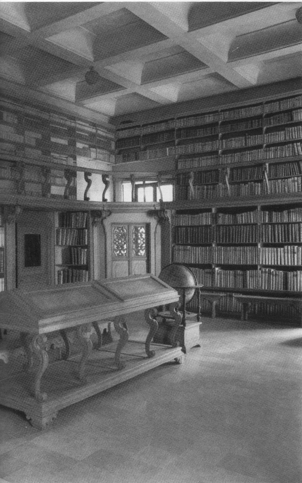
◀ La sala D della Biblioteca Gambalunghiana di Rimini, costruita su disegno del pittore Giovan Battista Costa nel 1756.

sissimi mezzi alla biblioteca, non avevano fatto alcun lavoro sull'edificio, disponevano stanziamenti ridicoli per i libri, per gli aggiornamenti bibliografici, per i restauri, per le legature”.