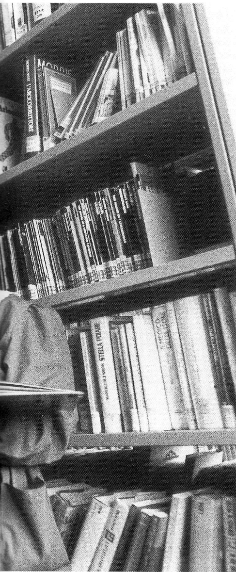
G. PASTORINI, Concorso "La biblioteca e il suo pubblico" (Unguento, 1993)

Molto spazio negli interventi sulle biblioteche scolastiche è dedicato al materiale non librario, sia audiovisivo che elettronico. Sandra J. Olën ( Utilization and Perceptions of the School Media Centre , "South African Journal of Library and Information Science", March 1993, p. 35-42) usa il termine di "school media centre" come equivalente di "school library", ad accentuare la molteplice tipologia dei mezzi di informazione: vengono in mente le "mediateche", che sembrano sottintendere un distacco dalle vecchie "biblioteche", mentre in realtà queste ultime dovrebbero possedere in sé sufficiente elasticità e potenzialità da conservare il proprio nome mutando o modificando il proprio contenuto. Nel Sudafrica incominciano a formarsi questi centri, che tra gli altri scopi si propongono "di render consapevole l'allievo che il centro multimediale è solo una parte o un sottosistema del più ampio sistema informativo esistente nella comunità, nel paese e in un contesto globale e di educare l'allievo ad essere un utente indipendente delle biblioteche e dell'informazione nella comunità". Questi centri sono costosi ma anche sottoutilizzati, e non solo nella situazione sudafricana, a volte perché le condizioni socioeconomiche modeste possono costituire un deterrente ➤