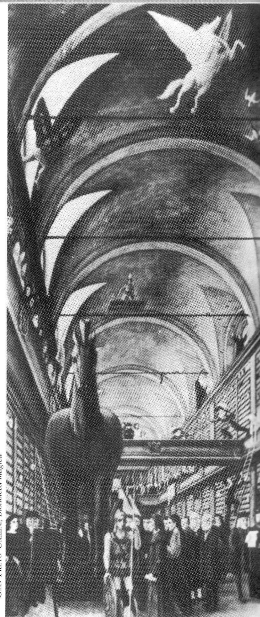
GIAN FRUPO USSELLI, Biblioteca magica

Appaiono immediatamente evidenti le difficoltà a tradurre in pratica questi dettati nelle biblioteche che dipendono da enti pubblici, qualora non intervenga un