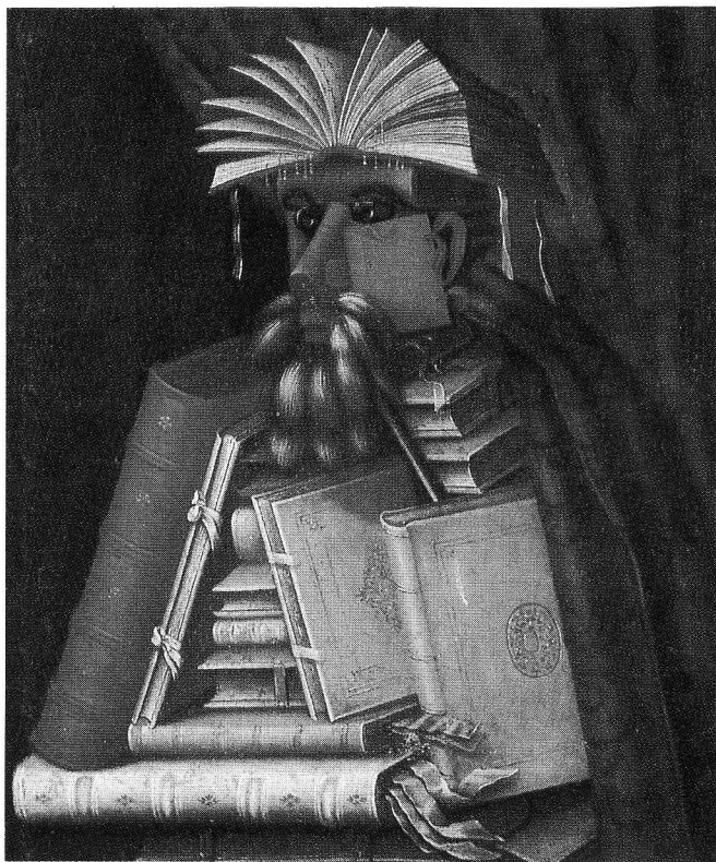
Giuseppe Arcimboldi, Il bibliotecario .