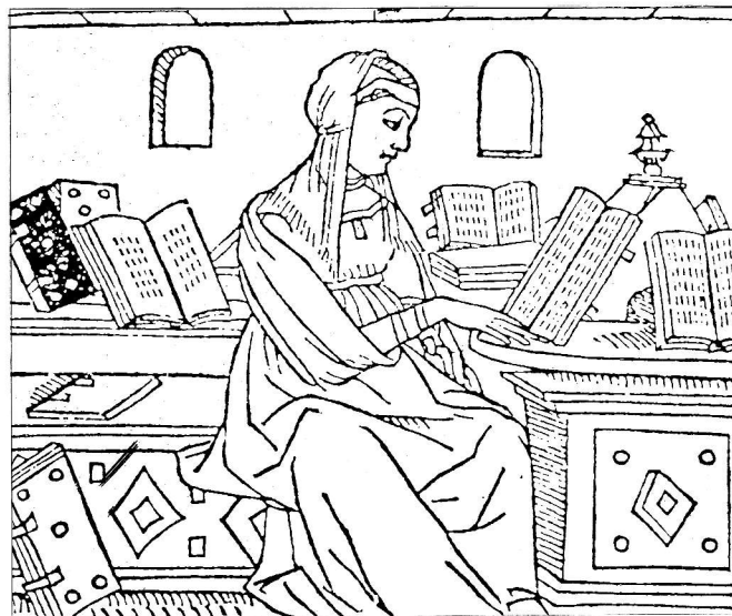
Giacomo Filippo Foresto, illustrazione da De plurimis claris selectisque mulieribus , Ferrara 1497.

Nel 1967 la biblioteca, che allora costituiva l'unico istituto italiano specializzato nel settore dell'archeologia e della storia dell'arte, con fondi librari indispensabili e spesso unici